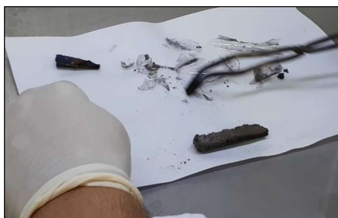
Secuenciación de imágenes de la primera parte del TP