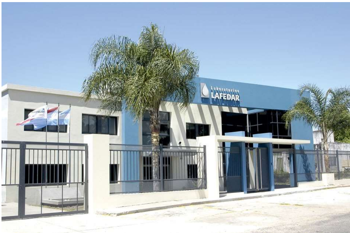
Ilustración 1 - Foto de la empresa