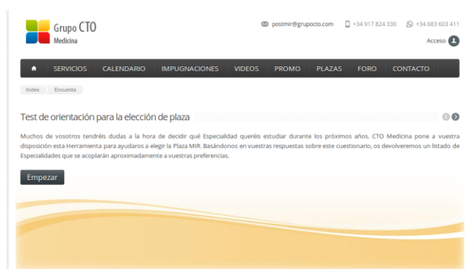
Fig. 4. Test de Orientación Especialidad

La encuesta evalúa tanto los aspectos personales como los profesionales del alumno. A través del enlace http://postmir.grupocto.es/Encuesta , es posible acceder a la encuesta, como lo indica la Figura 4.