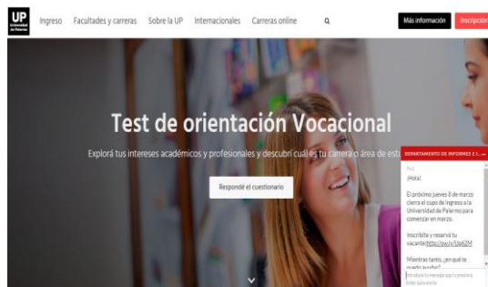
Fig. 3. Test de Orientación Vocacional