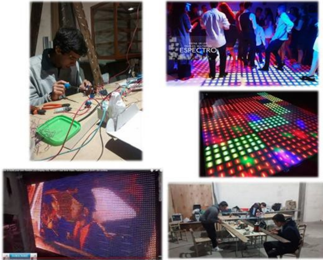
Figura 3 Proyecto Incubado “Electrónica multimedia. Espectro - Ar”