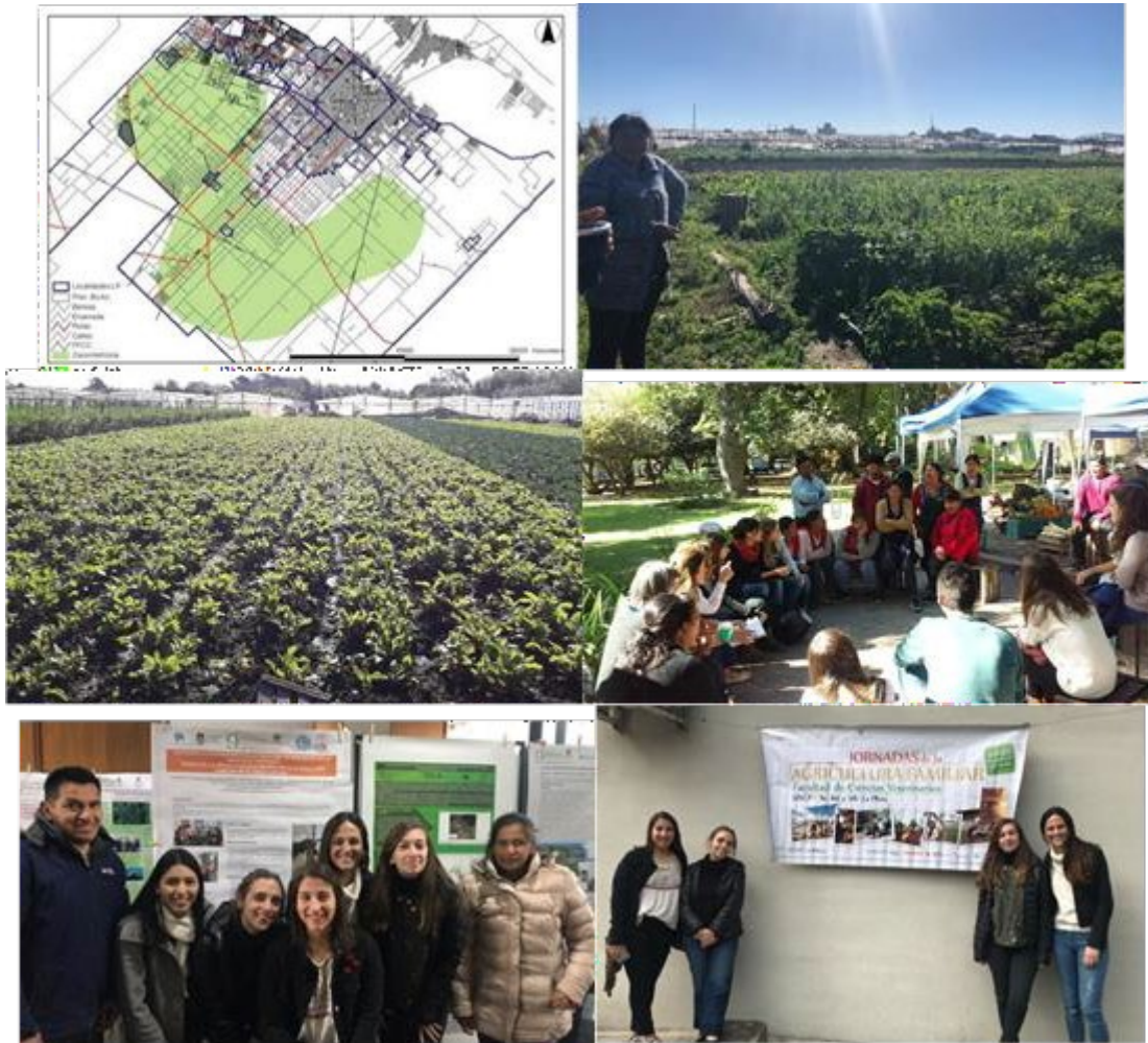
Figura 7 Proyecto Fortalecimiento de la Agricultura Familiar en el Gran La Plata Manos de la Tierra

desfavorables del sector. Este mismo compromiso se puede “contagiar” a futuros estudiantes para que sigan con este deseo de querer aportar e incorporar conocimientos y colaborar con un sector trabajador generalmente postergado y desvalorizado erróneamente.