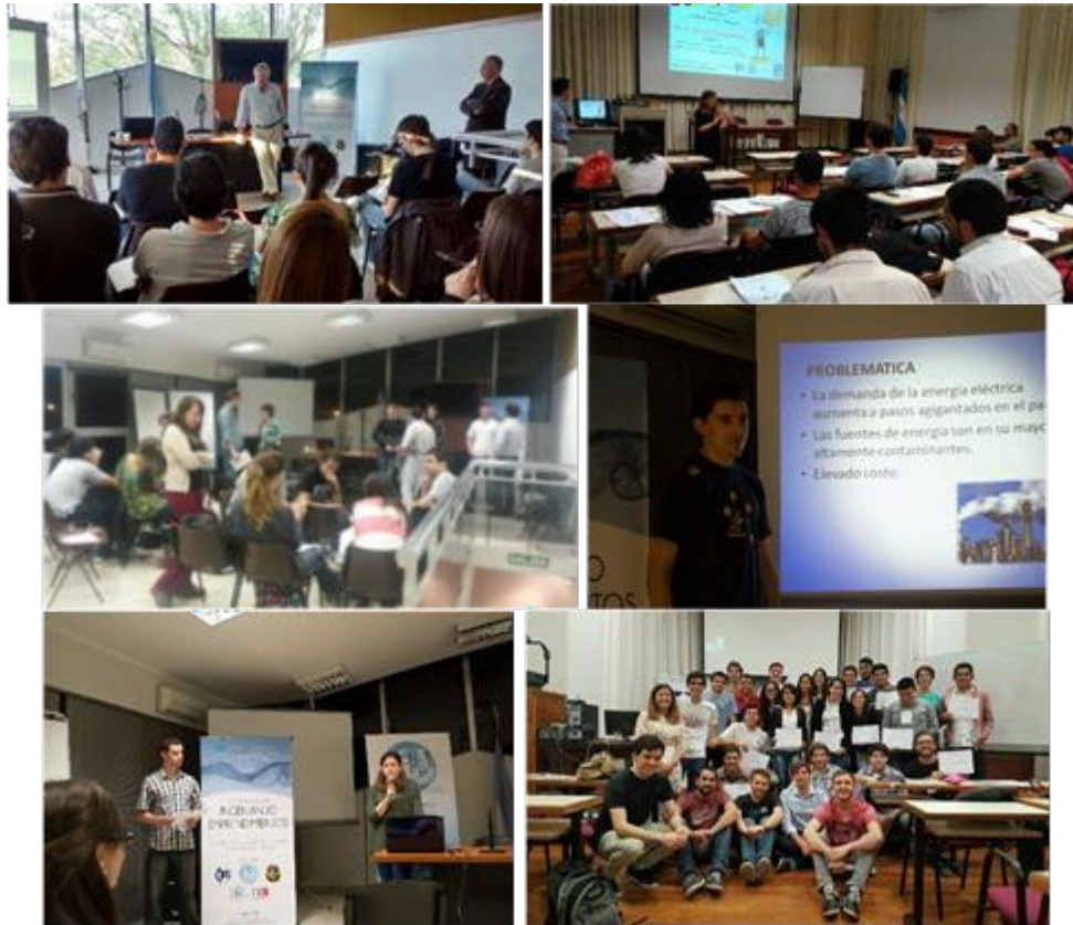
Figura 2 Actividad Ingeniando Emprendimientos