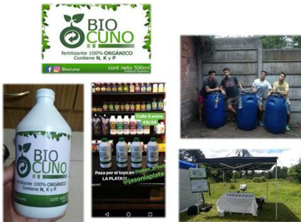
Figura 6 Proyecto Incubado “Biocuno”