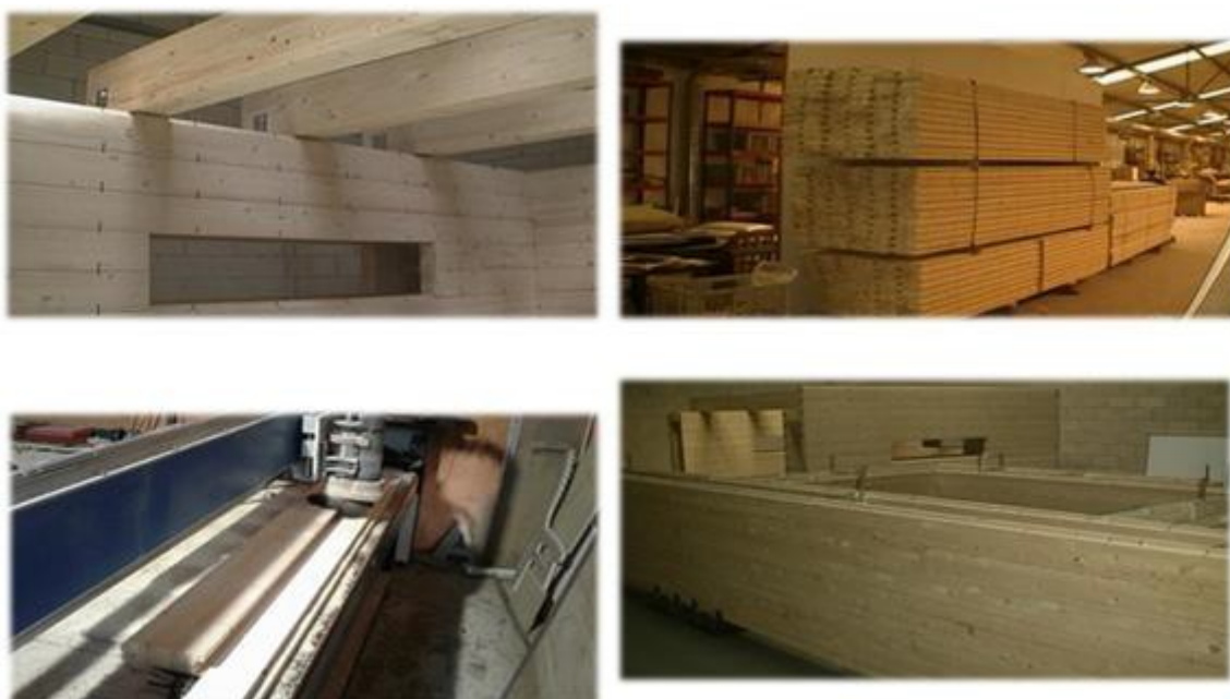
Figura 4 Proyecto Incubado “Muro portante de tabique doble madera arriostrado”