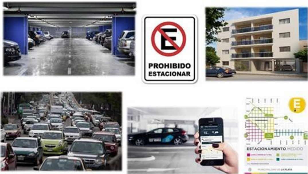
Figura 5 Proyecto Incubado “Spin parking”