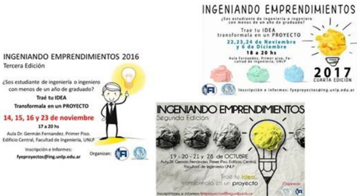
Figura 1 Flyers de difusión Actividad Ingeniando Emprendimientos años 2015, 2016 y 2017.

El objetivo de esta actividad es promover la formación, incorporación de herramientas y desarrollo de habilidades en la detección de oportunidades de negocio de base científica y tecnológica. Se realiza un Concurso de Ideas-Proyecto donde los alumnos agrupados en equipos, con integrantes de distintas especialidades de ingeniería, elaboran un plan de negocio en nivel de idea-perfil que da respuesta a problemáticas actuales del país, las cuales son presentadas a los alumnos en el primer encuentro. Cada equipo es acompañado por un equipo de ingenieros tutores que los guían de forma complementaria a las actividades grupales. Se realizan actividades de formación en las temáticas de formulación y evaluación de proyectos, elaboración de planes de negocio y finanzas para emprendedores. La actividad dura una semana con encuentros diarios y al final de la misma, un Comité Evaluador elige a los ganadores del Concurso. Se entregan certificados de asistencia a todos los participantes y menciones a los primeros puestos. Durante la semana también se realizan dinámicas de grupo que de forma complementaria a las clases teóricas buscan desarrollar el espíritu emprendedor y habilidades necesarias para emprender en los participantes. Esta actividad se desarrolló en cuatro oportunidades, siendo la primera edición en el año 2014.