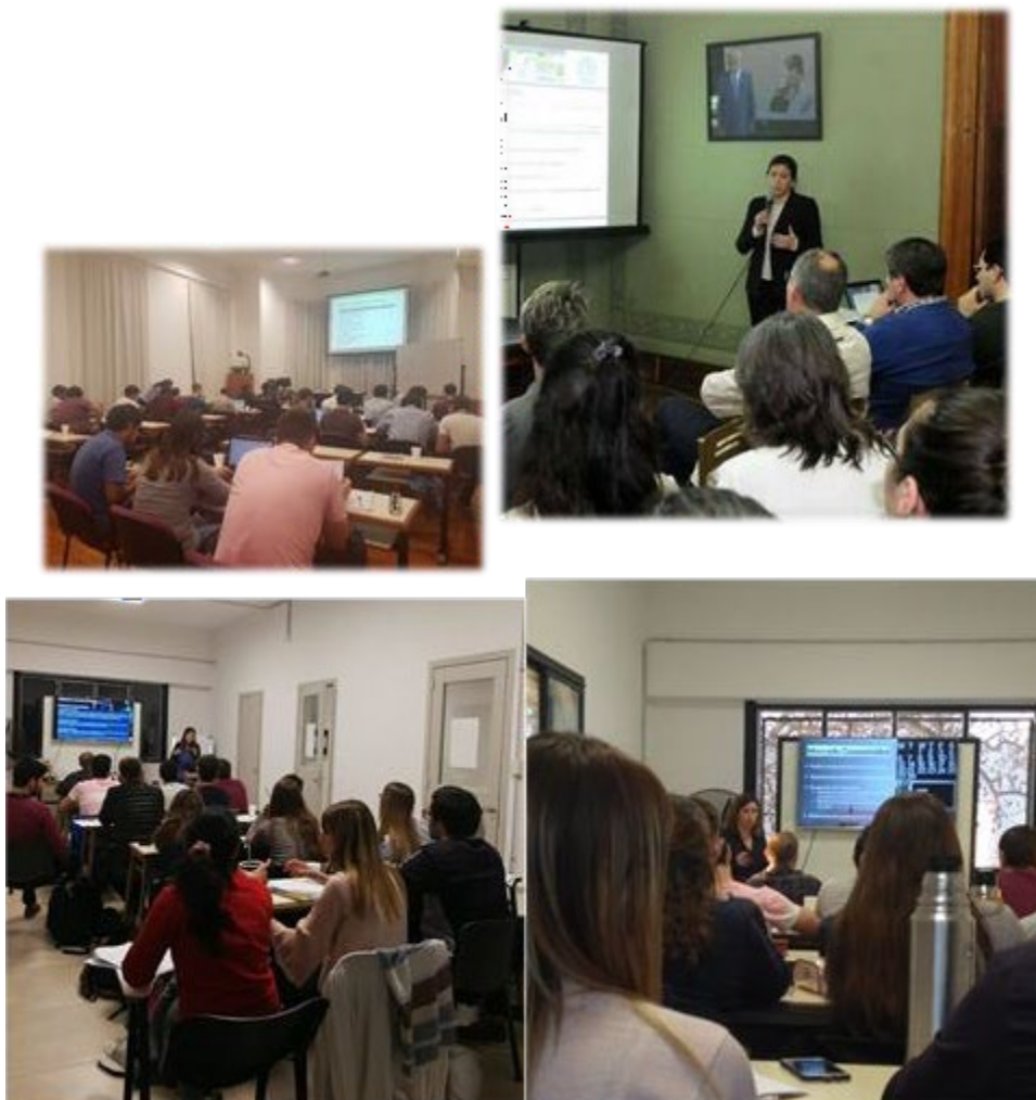
Figura 9 Actividades de Post Grado y Formación Continua

Destinado a graduados y alumnos del último año de todas las carreras de ingeniería, tiene una duración de 30 hs y su objetivo es que los participantes adquieran conocimientos introductorios y herramientas para confeccionar un plan de negocios y evaluar inversiones desde el punto de vista privado, desarrollando al mismo tiempo la capacidad de tomar decisiones respecto de sus principales variables: inversión, costos, financiamiento, etc.