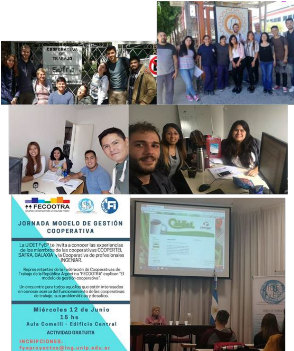
Figura 8 Programa de asistencia a la Federación de Cooperativas de Trabajo de la República Argentina