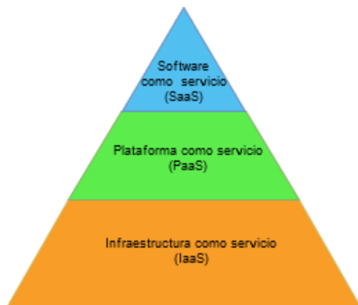
Fig. 2 - Niveles de servicio en la nube [8]

Infraestructura como Servicio ( IaaS ), es la capa de abstracción más baja de la arquitectura en la nube y se encarga de proveer recursos básicos como procesamiento, almacenamiento, redes y otros recursos informáticos fundamentales como servicios estandarizados a través de la red [12]. En este modelo, el usuario no administra la infraestructura de la nube pero tiene control sobre los sistemas operativos, almacenamiento y aplicaciones implementadas y posiblemente el control limitado de componentes de red seleccionados (por ejemplo, firewalls de host) [11]. La mayor ventaja de IaaS es que los usuarios pueden usar y liberar recursos computacionales en forma dinámica, pagando sólo por la capacidad que realmente se utiliza [5]. La virtualización se utiliza ampliamente en el modelo IaaS con el fin de integrar o descomponer los recursos físicos para satisfacer la demanda creciente o decreciente de recursos computacionales en la nube. La estrategia básica de la virtualización es la creación de máquinas virtuales independientes que están aisladas tanto del hardware como de otras máquinas virtuales [13]. La virtualización permite la abstracción y el aislamiento de las funcionalidades de nivel inferior y el hardware asociado [14]. De esta manera, se logra la portabilidad de las funciones de nivel superior y el intercambio y/o agregación de los recursos físicos [14].