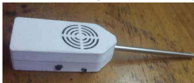
vista del gabinete correspondiente

A continuación en la Fig. 2 se observan el diseño y