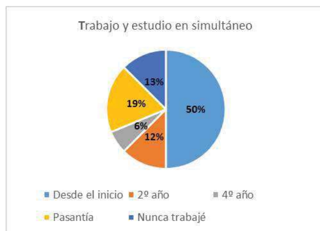
Fig. 3. Trabajo y estudio en simultáneo a lo largo de la carrera.

A fin de analizar si con esta carrera se cumplía el espíritu de la Universidad Tecnológica Nacional, que es brindar la posibilidad de estudiar a alumnos que trabajan, se les consultó a los graduados si trabajan mientras estudiaban.