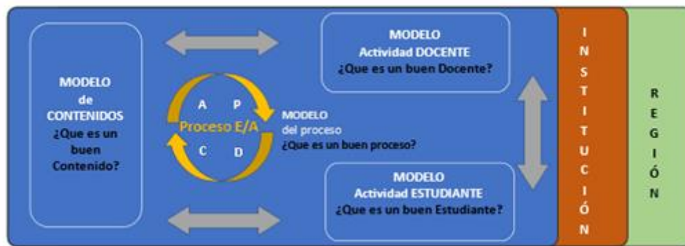
Figura 1. Modelo de Calidad EDPC: Estudiante – Docente – Proceso – Contenido