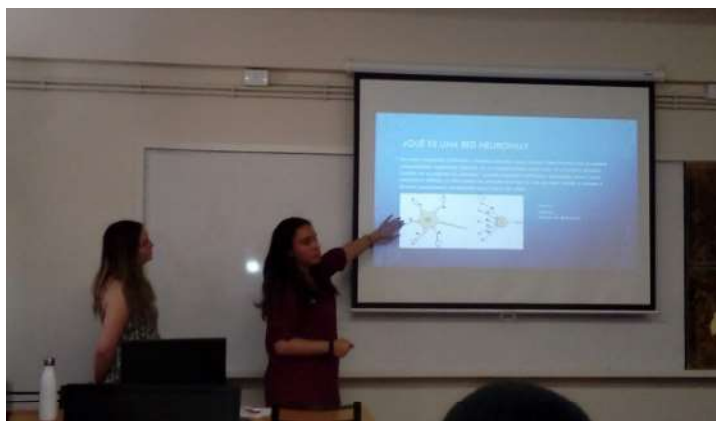
Fig.1. Seminarios expositivos de alumnos investigadores donde se comparten y explican las características y avances de sus temas de investigación.

Muy poco tiempo después del inicio de clases, el 19 de marzo de 2020, mediante el DNU 297/2020 (DNU, 2020), el presidente decretó el aislamiento social, preventivo y obligatorio en Argentina para intentar frenar la propagación del coronavirus que comenzaba a expandirse por todo el globo. A partir de ese momento, la situación sanitaria del país y el mundo cambió todo. Dentro del ámbito de investigación fue necesario modificar la forma de trabajo hacia un esquema que nos permitiese seguir avanzando en las actividades, aunque en un principio no resultó nada sencillo dimensionar las complicaciones que traería la nueva modalidad remota, ni el prolongado tiempo que se extenderían las medidas por la pandemia.