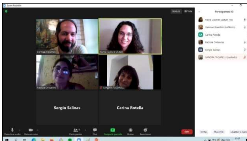
Fig.3. Encuentros con docentes investigadores en la modalidad de reunión virtual mediante la plataforma Zoom en el marco de la cuarentena por COVID-19.

Acerca de la redacción, revisión y corrección de artículos y demás textos para la participación en diversos eventos científicos (encuentros, conferencias, congresos, etc.), el esquema de trabajo se organizó mediante iteraciones por mail: los investigadores en formación inician la tarea esbozando borradores que los directores se encargan de revisar, efectuando devoluciones con correcciones y sugerencias sobre cómo tratar los temas y organizar los contenidos, que normalmente requieren la reestructuración del documento. Este proceso se reitera tantas veces como sea necesario hasta que el texto escrito alcanza la madurez necesaria para poder ser remitido para su consideración por los evaluadores del evento.