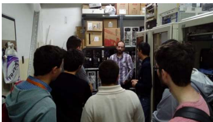
Fig.2. Visita con alumnos al nodo informático de la UTN-FRM en el marco de una charla sobre distintas arquitecturas de procesamiento paralelo.

Muy poco tiempo después del inicio de clases, el 19 de marzo de 2020, mediante el DNU 297/2020 (DNU, 2020), el presidente decretó el aislamiento social, preventivo y obligatorio en Argentina para intentar frenar la propagación del coronavirus que comenzaba a expandirse por todo el globo. A partir de ese momento, la situación sanitaria del país y el mundo cambió todo. Dentro del ámbito de investigación fue necesario modificar la forma de trabajo hacia un esquema que nos permitiese seguir avanzando en las actividades, aunque en un principio no resultó nada sencillo dimensionar las complicaciones que traería la nueva modalidad remota, ni el prolongado tiempo que se extenderían las medidas por la pandemia.