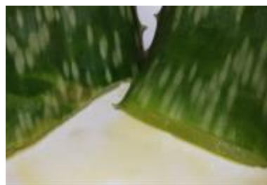
Figura 2. Extracto natural de Aloe Saponaria