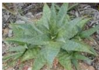
Figura 1. Plantación de Aloe Saponaria .

La materia vegetal ( A. saponaria ) corresponde al lote GAS3003 de un campo de la localidad de Balnearia situada en el departamento San Justo de la provincia de Córdoba (Figura 1).