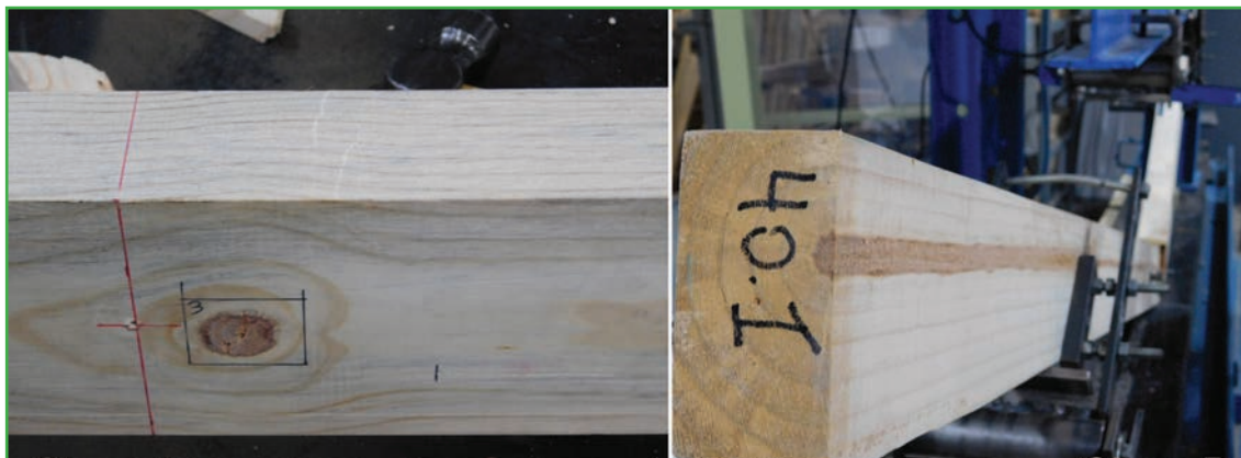
Figura 4: Tablas de pino ponderosa de la mejor calidad estructural y de calidad no-estructural. La tabla de clase 1 tiene nudos individuales menores a 1/3 del ancho de su cara, mientras que en la tabla de la clase D se observa la presencia de médula y los anillos de crecimiento de gran grosor.

visual estructural de la madera del pino ponderosa se encuentran disponibles en el SUPLEMENTO 1 DEL REGLAMENTO ARGENTINO DE ESTRUCTURAS DE MADERA CIRSOC 601-2016 Edición 2020 ( https://www.inti.gob.ar/areas/servicios-industriales/servicios-sectoriales/madera-y-muebles/cem ).