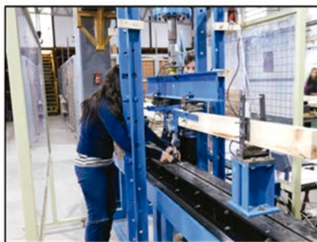
Figura 3: Esquema e imagen del ensayo estático a flexión según Norma UNE-EN 408. w : deformación (mm), P : carga (kg).