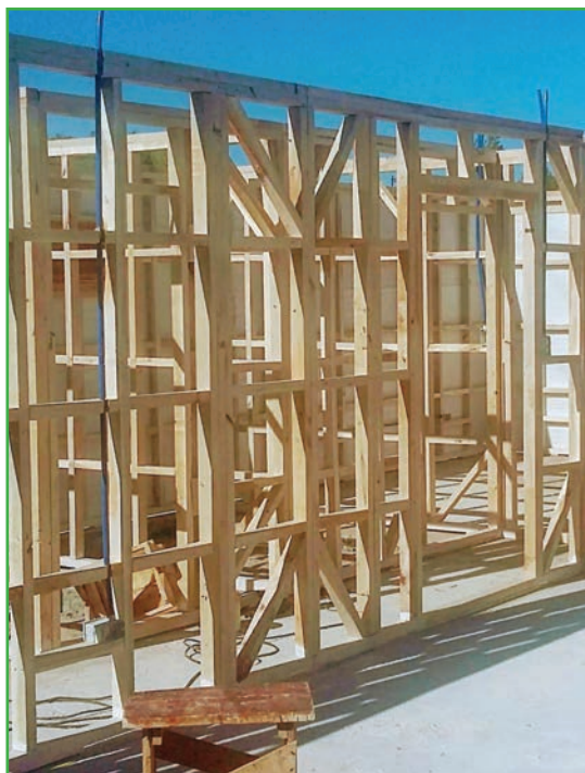
Figura 1: Sistema constructivo de entramado en madera.

El proceso de inscripción de una especie nueva al Reglamento CIRSOC 601 debe cumplir con ciertos requisitos. El primero es definir la población objeto de estudio (especie y procedencia), luego ensayar su madera en base a normas vigentes y finalmente proponer un método de clasificación según valores característicos de las propiedades físicas y mecánicas.