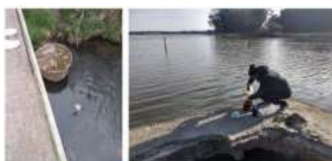
Figura 3. Recolección de la muestra

EC/EF : Los recuentos de E. coli y Enterococos fecales se llevaron a cabo siguiendo lo descrito en Standard Methods for the Examination of Water and Wastewater (2012).