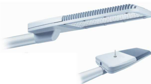
Figura 5 PHILIPS – Greenvision 140 W

Ante la necesidad de contar con soluciones sustentables se ha trabajado en el desarrollo de luminarias con tecnología led para iluminación vial. PHILIPS - Greenvision (XCEED-BRP372 M1 64LED – 140W) incorpora una nueva generación de plataforma led para alto rendimiento lumínico en Lm/W y con un significativo ahorro energético de más del 50% con relación a lámparas de descarga de sodio, aptas para iluminación en autopistas, rutas, avenidas, calles, espacios urbanos playones de maniobras, etc. (Figura 5 PHILIPS – Greenvision 140 W Figura 5)