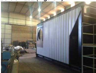
Figura 3 Caldera Gonella

Con base en la premisa anterior se evalúan propuestas y se adquiere un equipo de la empresa nacional Gonella. Dicho equipo es un hogar de piso móvil (Figura 3), de grilla escalonada que permite la alimentación de residuos, chips y corteza en su extremo superior, permitiendo su quema controlada. La ubicación del nuevo equipo se realiza en paralelo al de la de la planta de energía uno para aprovechar la alimentación de biomasa (Figura 4).