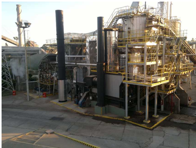
Figura 4 Ubicación de la caldera en MDF2

Con el nuevo equipo se logran los ahorros de combustible estimados y una mejora en los indicadores de ecoeficiencia, que se detallan a continuación: (i) un ahorro de 1.200.000 m 3 /año de gas natural en operaciones normales y un ahorro de 40.000 litros de gas oíl/año en operaciones en fechas de restricción en el consumo de gas natural; (ii) disminución del 9% en el indicador de Energía Fósil más Eléctrica; (iii) disminución del 25% en el indicador de emisiones de CO 2 ; (iv) disminución del 50% en los residuos a disposición final que se utilizarían como biomasa combustible.