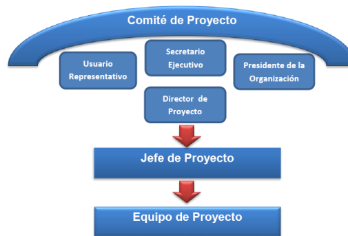
Fig. 1. Equipo de gestión de la propuesta metodológica.

La propuesta metodológica está constituida por fases y componentes, e identifica una estructura organizativa con roles y responsabilidades bien definidas para gestionar los proyectos de TICs (ver Figura 1). Los roles y responsabilidades se definen a través de la estructura establecida por PRINCE2, que por ser jerárquica, es la que más se adapta a las necesidades particulares y al entorno de la Administración Pública. Por el contrario, la estructura de METRICAV3 está muy enfocada en el desarrollo de productos de software y por otro lado, APM, establece una estructura tipo “hub” imposible de aplicar en un entorno particular de la administración pública. Por otra parte, esta estructura involucra a las autoridades, dentro del Comité de Proyecto, para lograr compromiso, responsabilidad, involucramiento y respaldo, al Jefe de Proyecto y a su equipo.