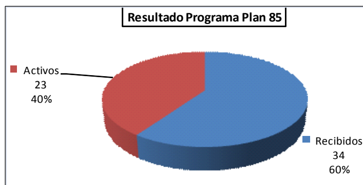
Fig. 1 Resultado Programa Plan 85

Además hay 23 estudiantes que todavía continúan activos, es decir rindiendo asignaturas durante el ciclo actual.