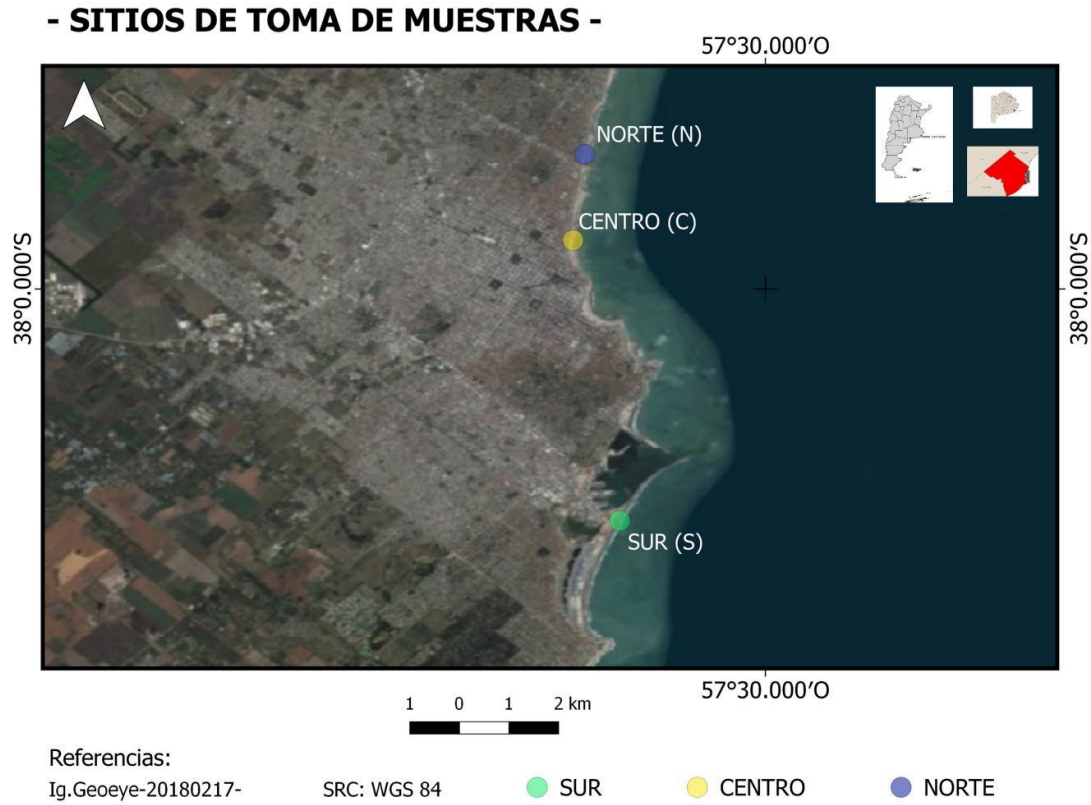
Fig.1: Ubicación de la ciudad balnearia de mar del plata en la provincia de buenos aires, y localización de las playas seleccionadas para este estudio: norte (n); centro y (c) sur (s), dentro de su ejido urbano.