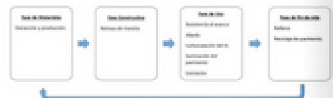
FIGURA 1 FASES DE EVALUACIÓN.

Las unidades funcionales en un análisis de ciclo de vida evidencian un proceso fundamental que puede variar, en función de los materiales implicados y de las adiciones que se vayan a utilizar en el proceso. En la Figura 2, entre cada una de las unidades funcionales marcadas con línea punteada existe un proceso de transporte; el cual no se debe desestimar, ya que implica tanto consumo de recursos como emisiones. Estas unidades están vinculadas con las distancias que se deben recorrer, así como la eficiencia energética de cada transporte que realice la operación. Por ende, en este análisis, entra en juego la estrategia ubicación de la extracción de materia prima, la elección de la planta asfáltica a utilizar y los vehículos correspondientes que lleven a cabo la tarea.