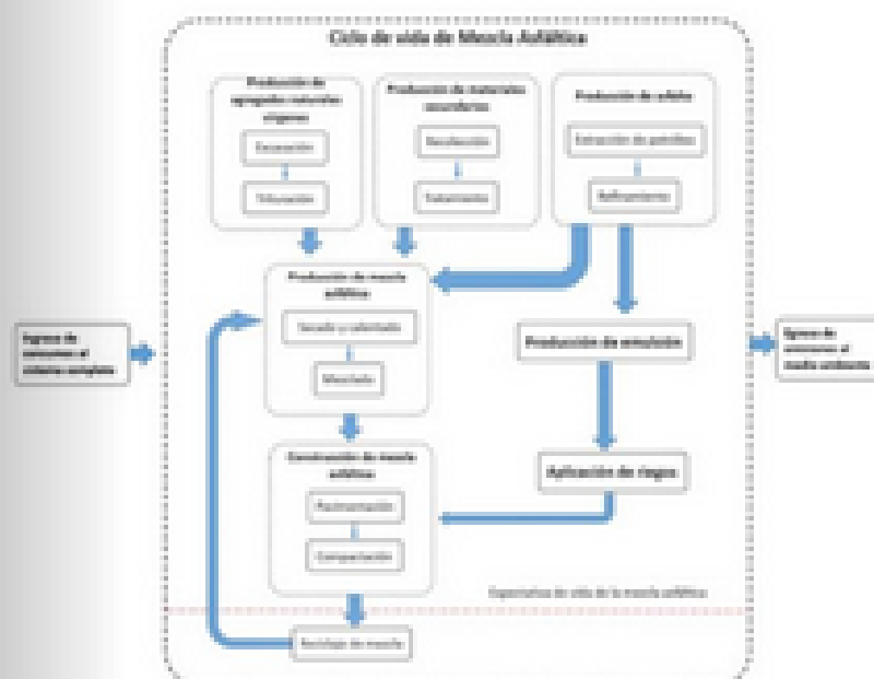
FIGURA 2 CICLO DE VIDA DE LA MEZCLA ASFÁLTICA

empírico-mecanicistas (BackVid, FitraPAVe, MEDINA, CR-ME Flexible, 3D MOVE análisis, etc.). En base a los distintos resultados, se debe analizar cuál ofrece un mejor desempeño en cuanto al ciclo de vida, teniendo en cuenta las funciones de desempeño y, posiblemente, una rehabilitación programada para cierta vida útil.