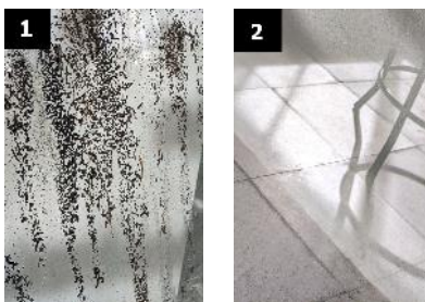
Figura 2. Aplicación de la formulación D (1) Antes de aplicar, (2) después de aplicar

Con respecto a la aplicación de los mismos, a continuación, se registra la efectividad de la formulación D. Tal y como ilustra la Figura 2 , el vidrio se encontró en un principio invadido por tierra, agua sucia y marcas (1). Al aplicar la formulación, el mismo se limpió por completo (2); no quedando trazas de colorantes, ni suciedad o marca alguna.