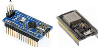
Fig. 2. Arduino nano y Esp 32, (base tecnológica para Cansat)

Es un sistema del tamaño de una lata de bebida gaseosa cuya misión puede ser recoger datos, efectuar retornos controlados o cumplir algún perfil de misión predeterminado.