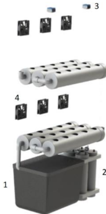
Fig. 3. Actuadores del Sistema.

La Figura 3, extraída de [2], presenta los diferentes actuadores del sistema, detallados en los incisos previos. Los números que se observan referencian a cada actuador.